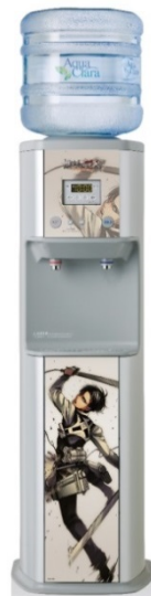
リヴァイ 原作モデル