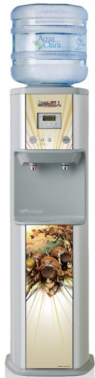
進撃の巨人モデル