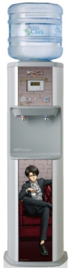
リヴァイ アニメモデル